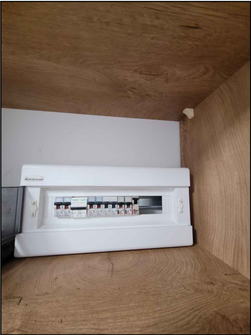
istn. Tablica Bezpiecznikowa TM1 - do przystosowania