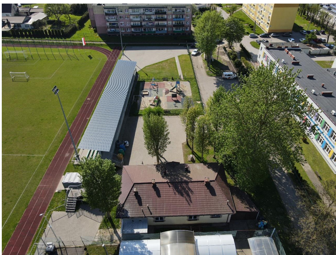
Rysunek 1. Zdjęcia budynku z drona.

Na podstawie powyższych danych opracowano koncepcję lokalizacji systemu fotowoltaicznego.