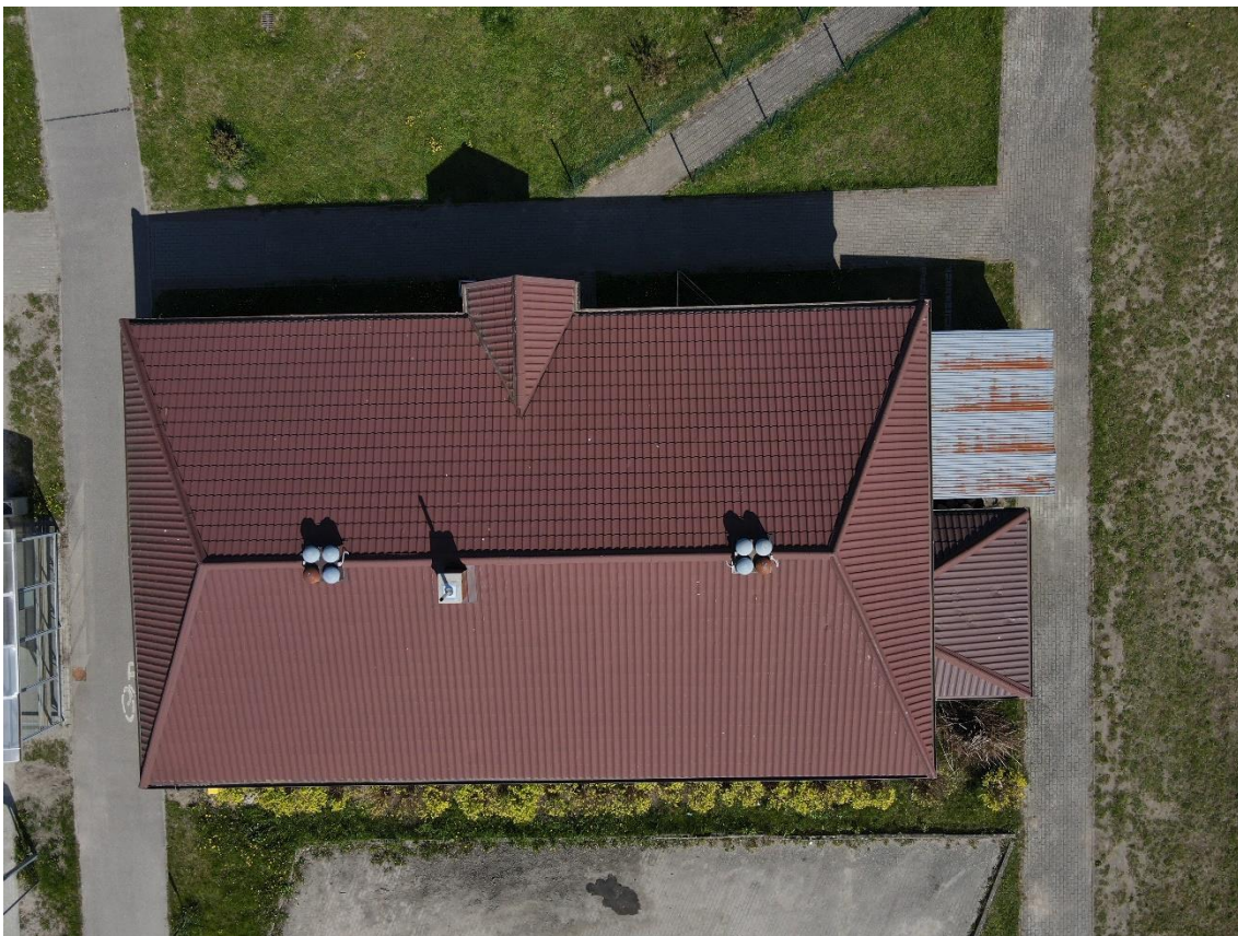
Rysunek 1. Zdjęcia budynku z drona.

Na podstawie powyższych danych opracowano koncepcję lokalizacji systemu fotowoltaicznego.